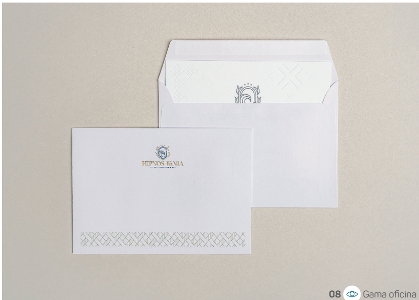
08 Gama oficina

05 / PLV DE MESA 10 x 15 x 5 cm 185 g papel blanco rígido Cuatri 1 cara