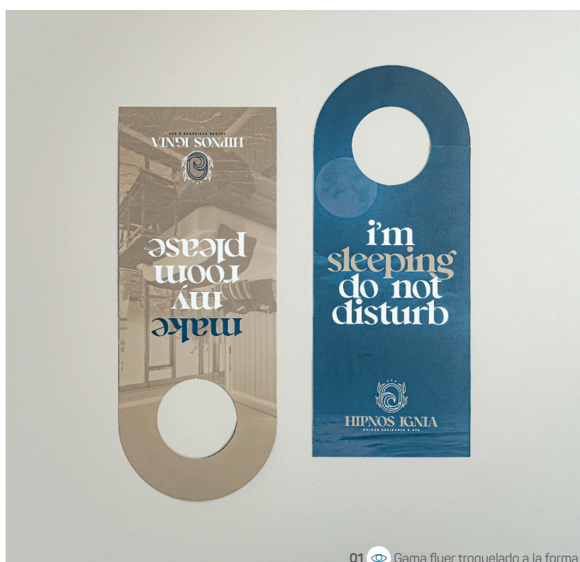
01 Gama flyer troquelado a la forma