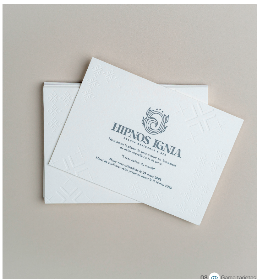
03 Gama tarjetas