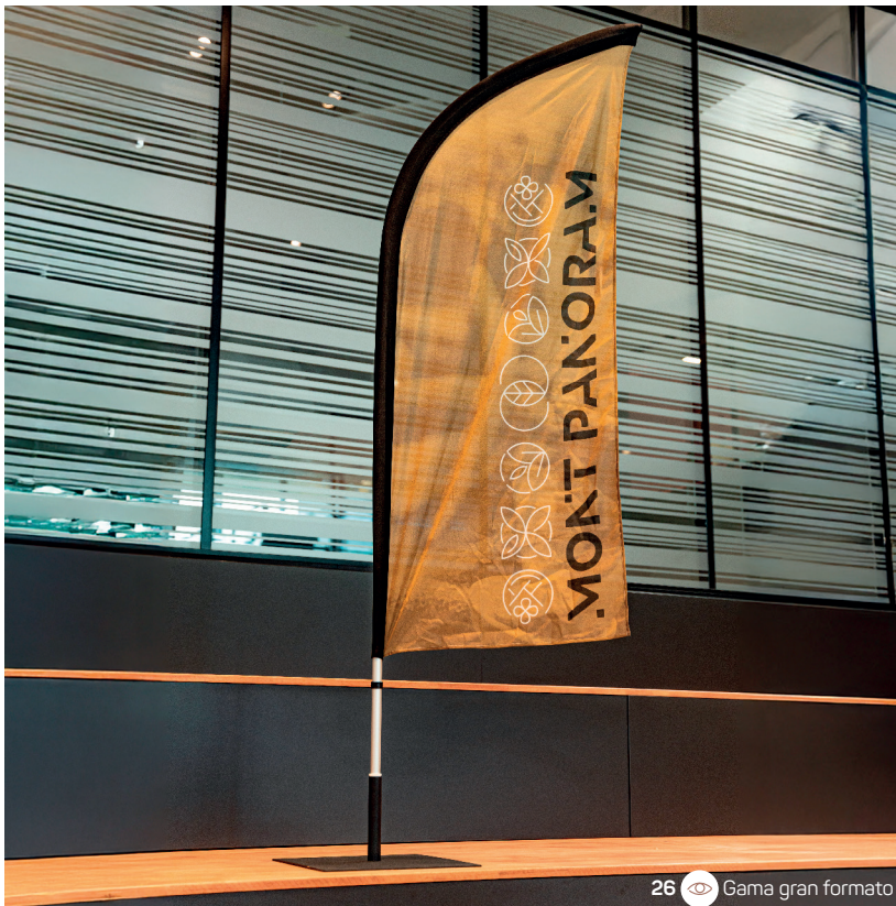
26 Gama gran formato

Las ferias son una oportunidad ideal para dejar huella y captar la atención desde el primer vistazo. Roll-ups, mostradores, mesas altas: cada elemento cumple un papel clave en la estructura del espacio y en maximizar la visibilidad. Un stand bien diseñado atrae naturalmente a los visitantes y deja una impresión duradera.