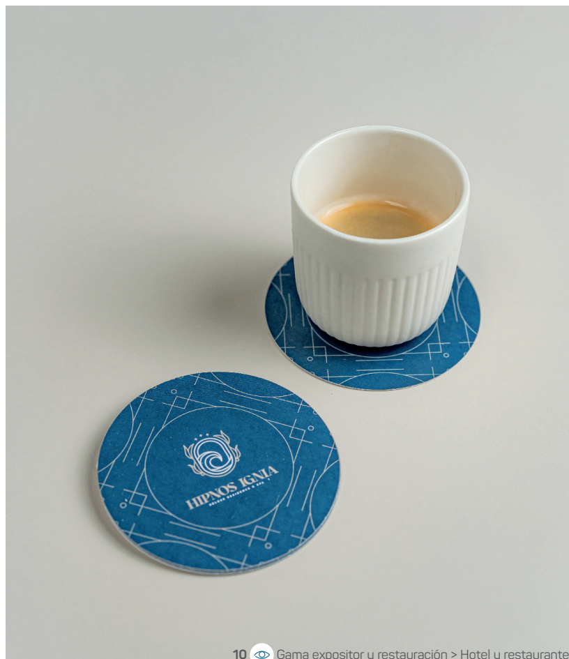
10 Gama expositor y restauración > Hotel y restaurante

Una caja con refuerzo o elegante aporta un toque sofisticado, reforzando así una imagen premium. Además, una pegatina bien diseñada atrae la atención, comunica con eficacia e influye positivamente en las decisiones de compra.