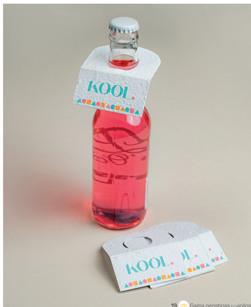
19 Gama pegatinas y vinilos