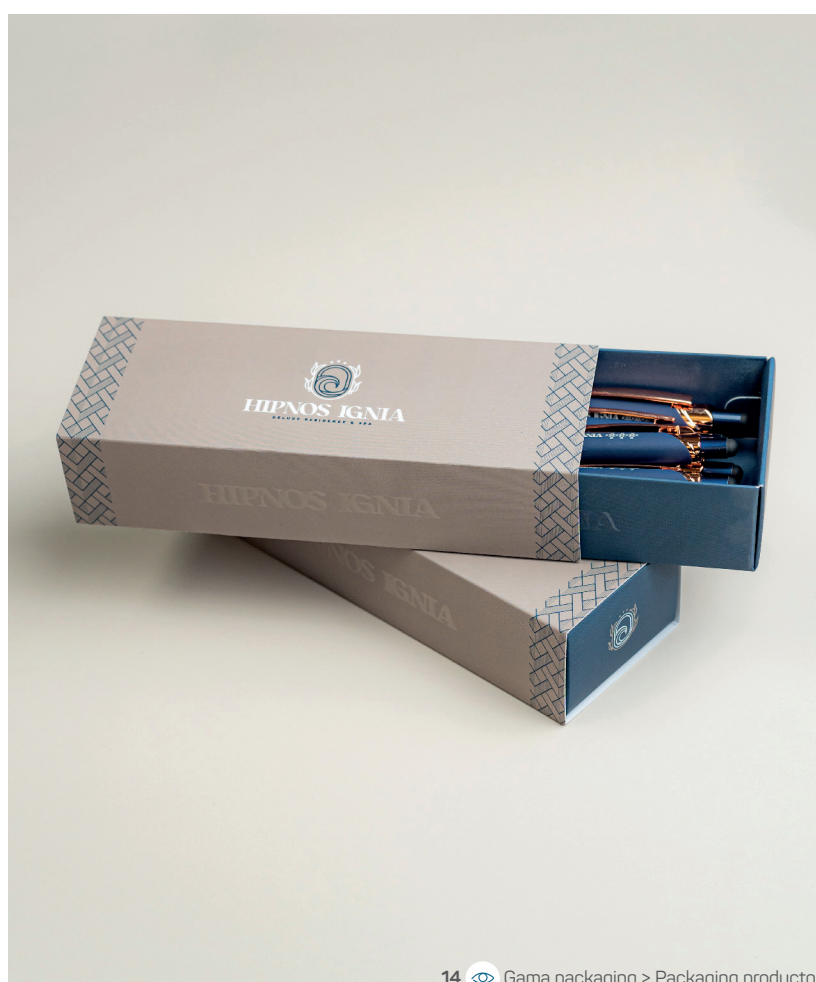
14 Gama packaging &gt; Packaging producto

6,5 x 9 cm 250 g estucado brillante Plastificado mate Soft Touch 1 cara Cuatri 1 cara