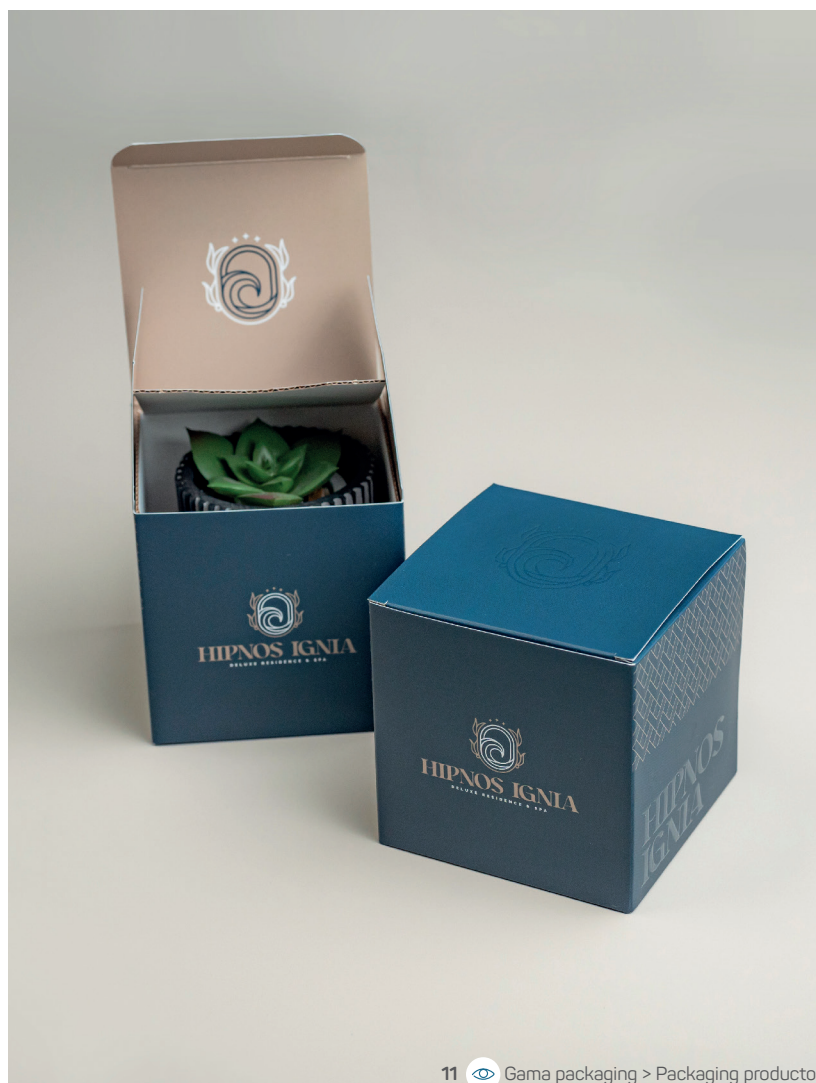
11 Gama packaging > Packaging producto