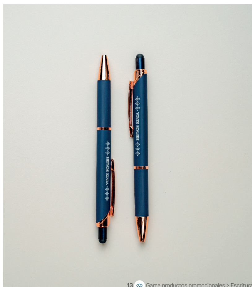
13 Gama productos promocionales &gt; Escritura

- EL 63% de los clientes prefiere materiales impresos para descubrir ofertas exclusivas. Un bloc de notas personalizado y un bolígrafo de calidad permiten a los clientes prolongar la experiencia más allá de la visita.