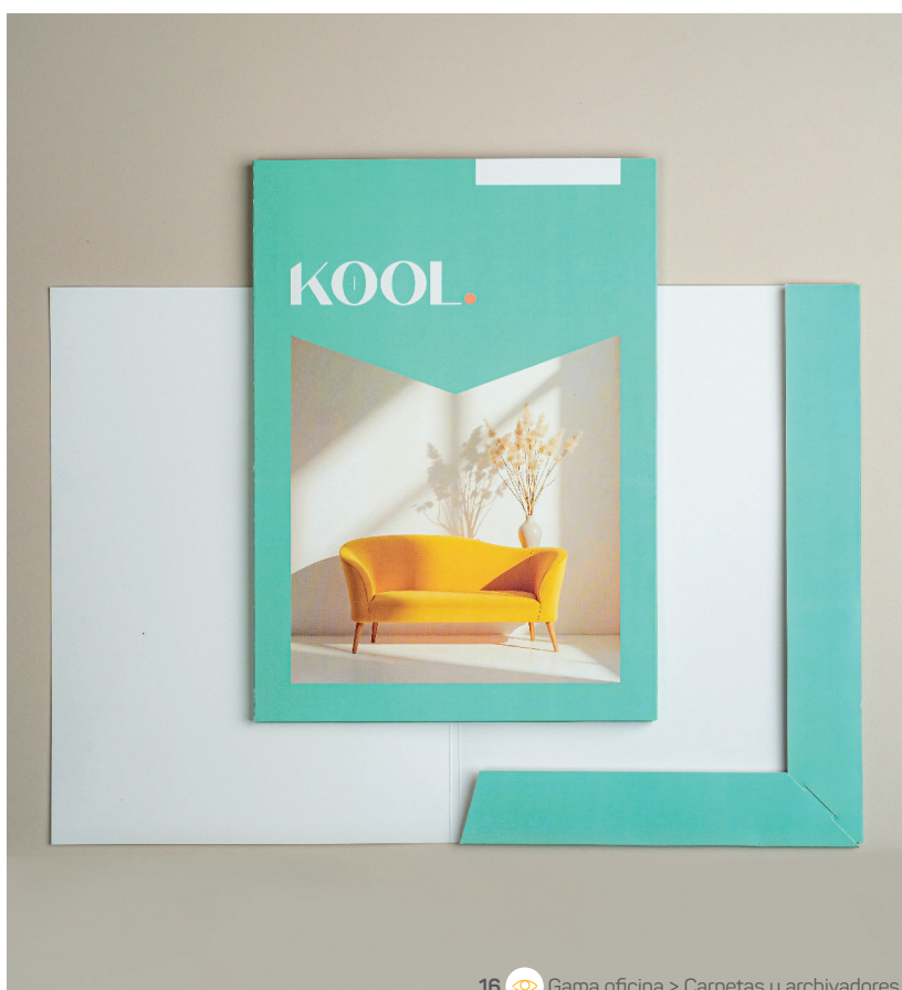
16 Gama oficina > Carpetas y archivadores

Los pequeños detalles marcan la diferencia. Pegatinas cuidadas, sellos de madera y collarines para botellas elegantes que aportan un estilo único a tus productos. Una concept store también es un universo, y cada elemento impreso ayuda a contar su historia. Cuando el diseño se une a la impresión, el impacto es inmediato.