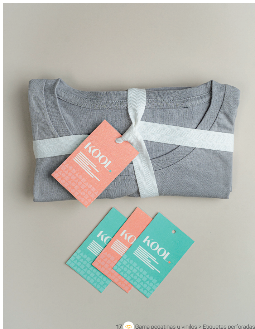
17 Gama pegatinas y vinilos > Etiquetas perforadas