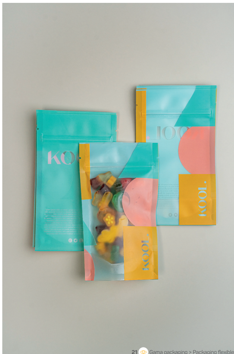
21 Gama packaging > Packaging flexible

Una caja de envío robusta o un doypack reciclable con acabado premium no solo protegen lo que contienen: también elevan la imagen de tu marca.