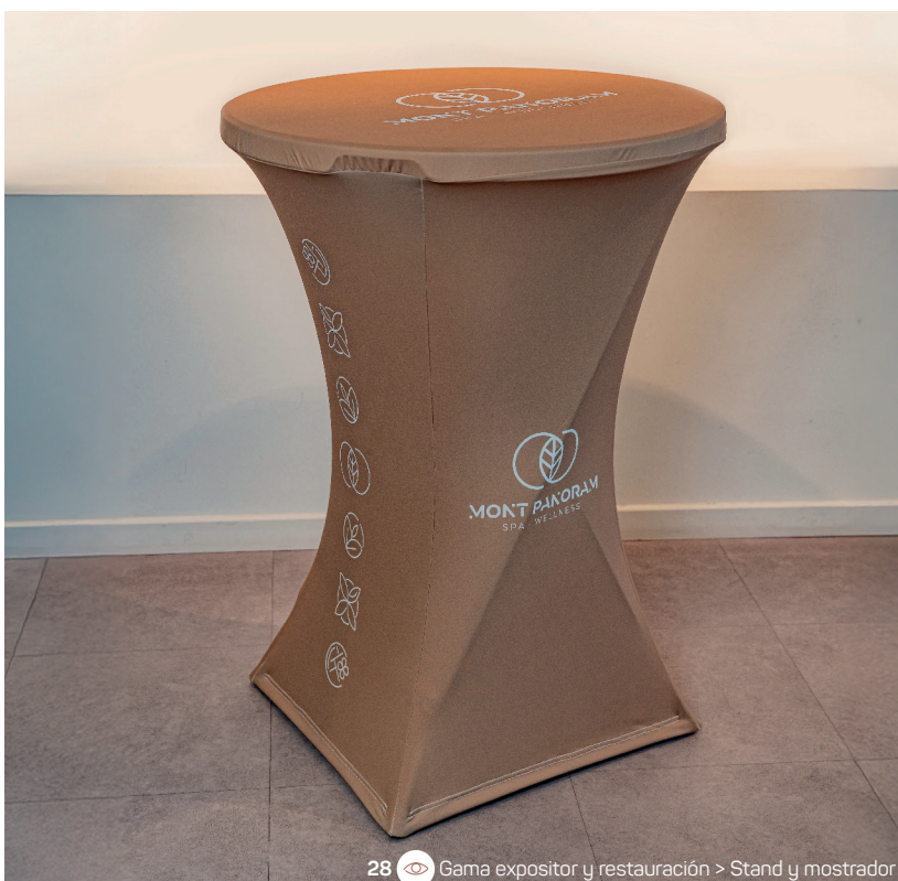
28 Gama expositor y restauración > Stand y mostrador