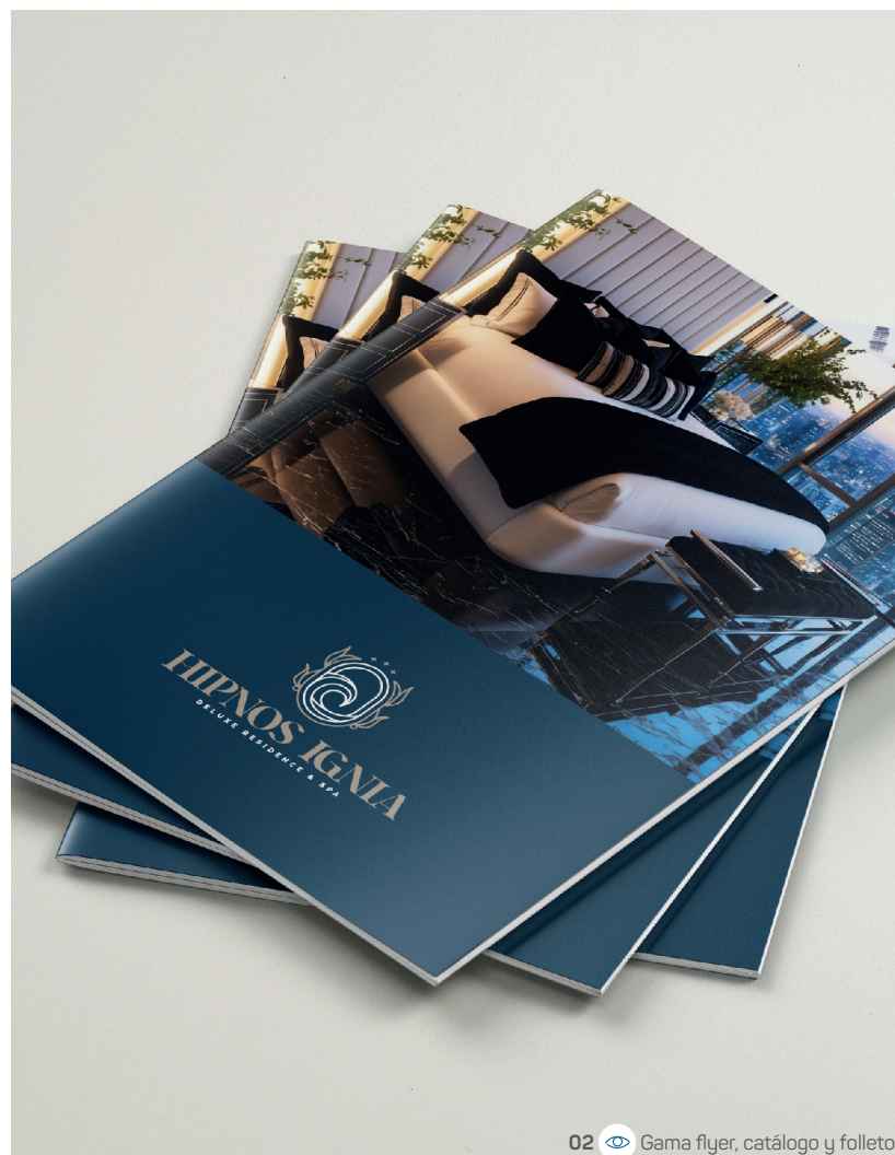
02 Gama flyer, catálogo y folleto

Desde el colgador de puerta hasta la tarjeta de visita, pasando por los PLV de mesa, cada detalle cuenta para dejar huella en la mente de tus clientes. Un hotel, un spa o un establecimiento de alta gama también se distingue por la calidad de su comunicación impresa. Ofrece una experiencia distinguida desde el primer contacto.