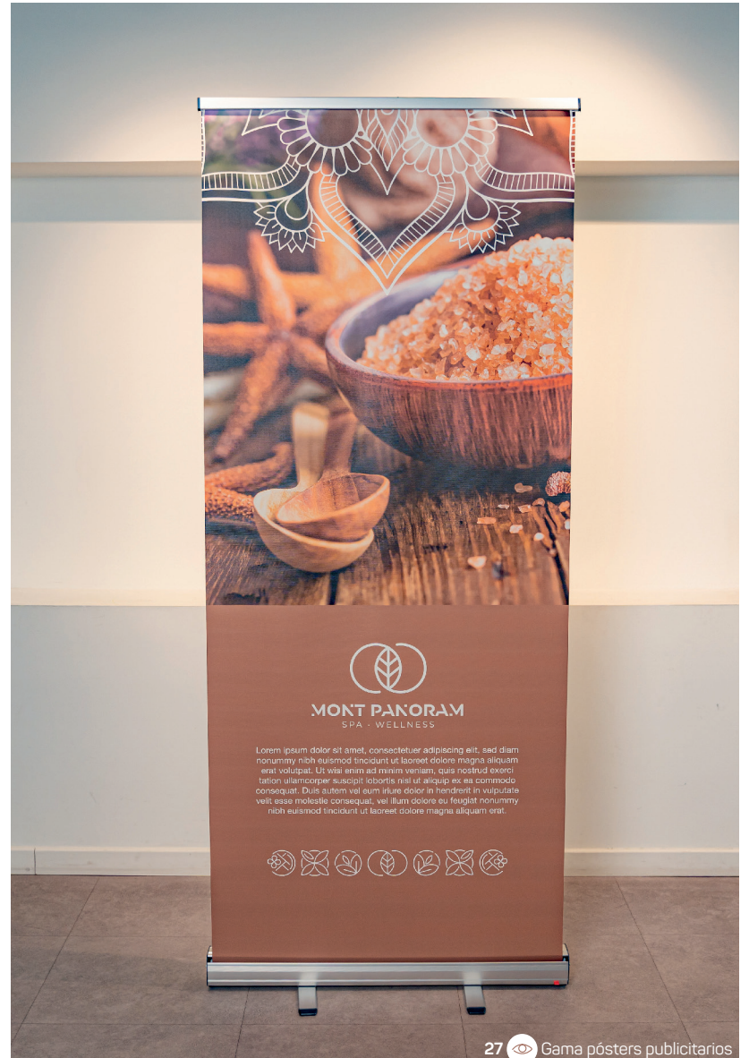
27 Gama pósters publicitarios