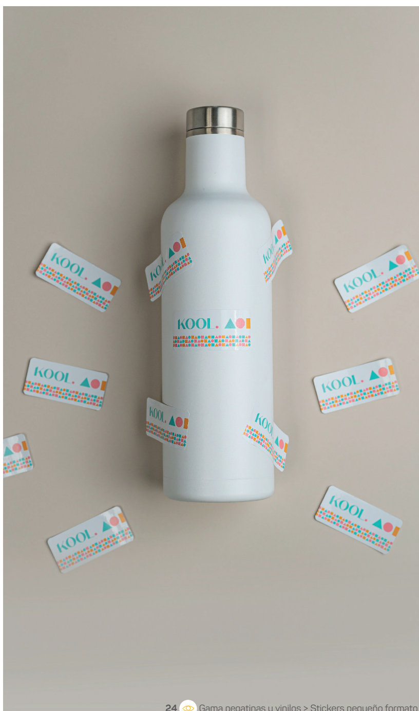
24 Gama pegatinas y vinilos &gt; Stickers pequeño formato