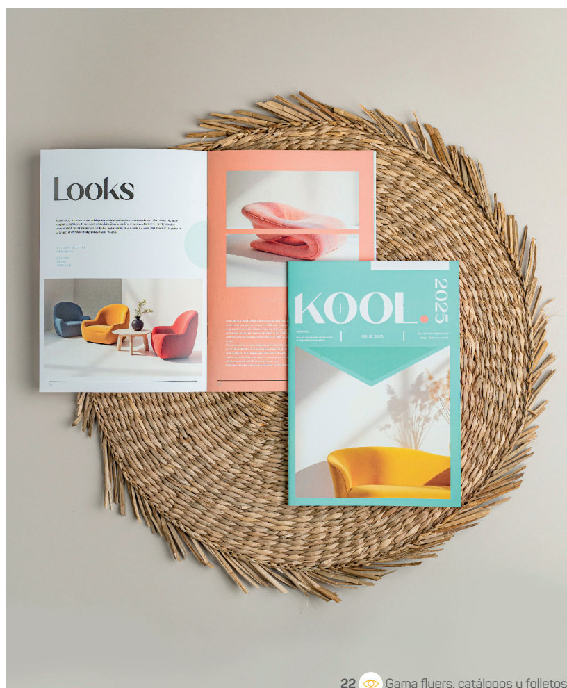
22 Gama flyers, catálogos y folletos

20 / CAJA DE ENVÍO 20 x 14 x 8 cm Cartón microcanal blanco Cierre con solapas Cuatri exterior