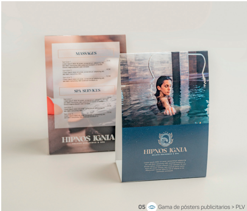
05 Gama de pósters publicitarios > PLV

08 / SOBRES C6 : 16,2 cm x 11,4 cm 120 g offset superior velin blanco puro Apertura lado grande Cuatri 1 cara