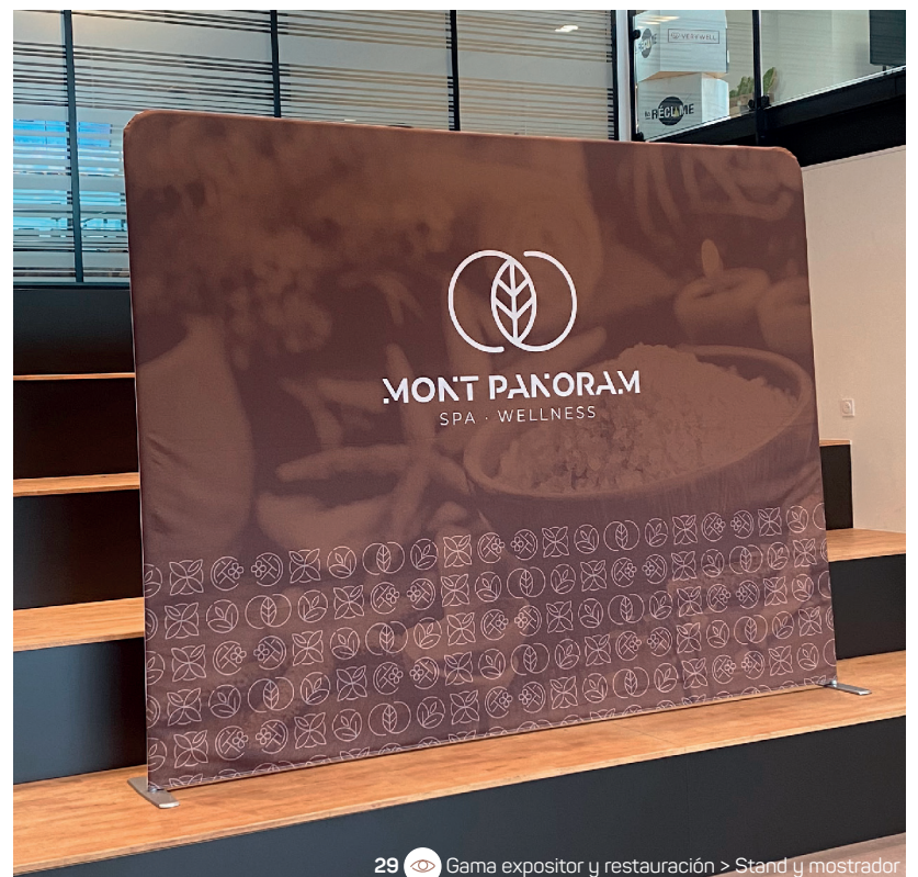
29 Gama expositor y restauración > Stand y mostrador