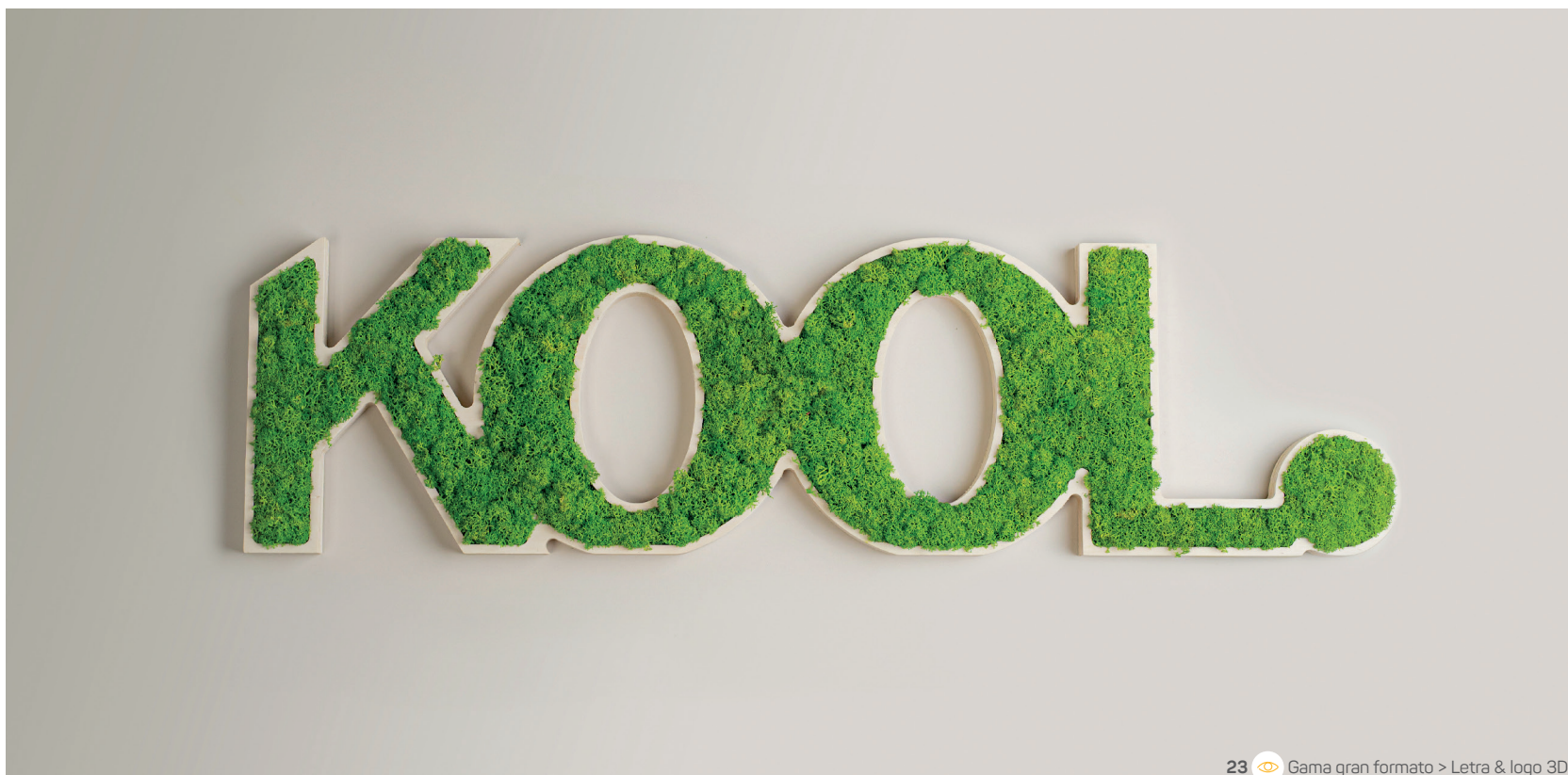
23 Gama gran formato &gt; Letra &amp; logo 3D

5 x 6 x 8 cm Madera de haya Grabado láser en dos lados