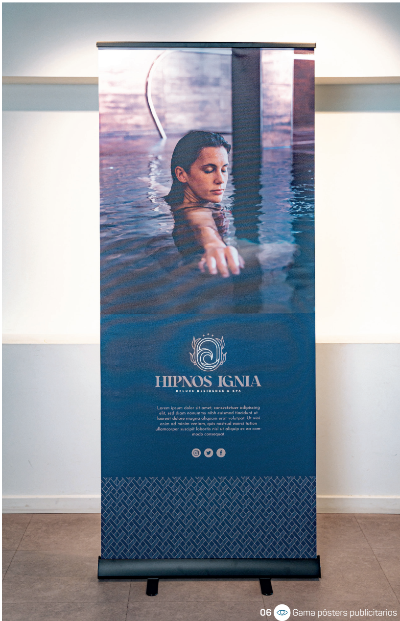
06 Gama pósters publicitarios

Las invitaciones cuidadas o los folletos elegantes permiten destacar sus ofertas y servicios, a la vez que refuerzan la imagen de su marca.