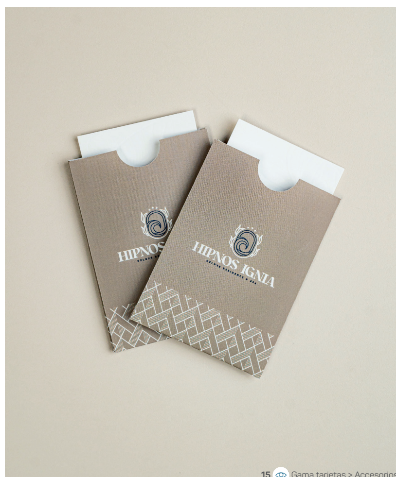
15 Gama tarjetas &gt; Accesorios