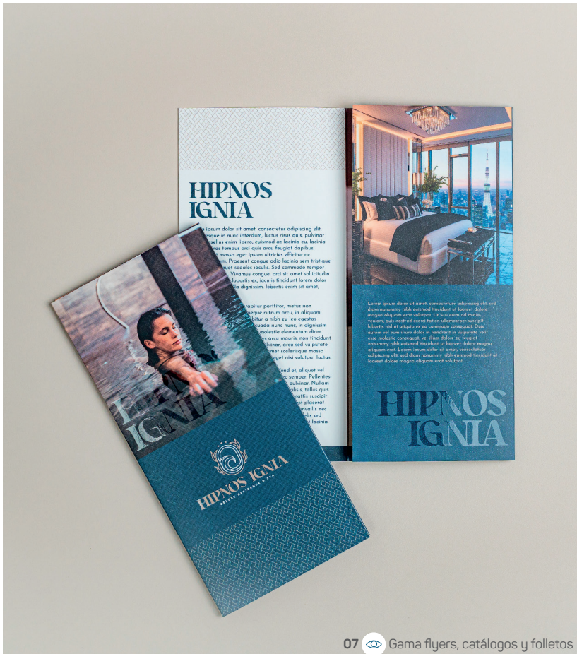
07 Gama flyers, catálogos y folletos