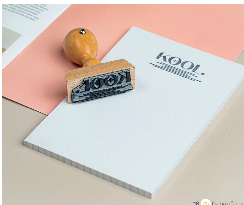
18 Gama oficina