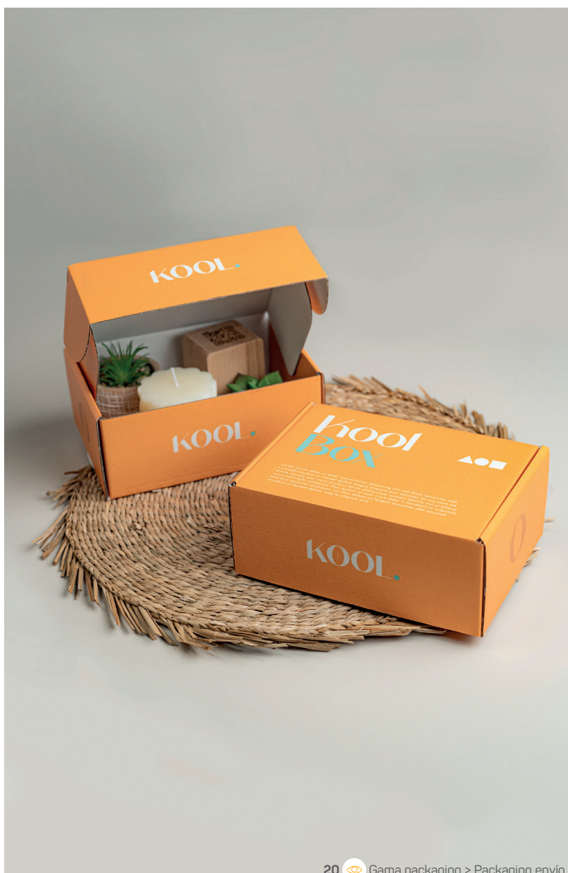
20 Gama packaging > Packaging envío