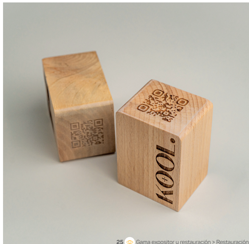
25 Gama expositor y restauración &gt; Restauración