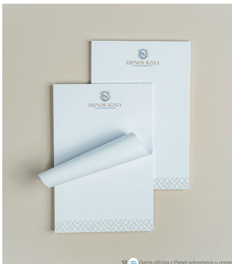
12 Gama oficina &gt; Papel sobremesa y notas