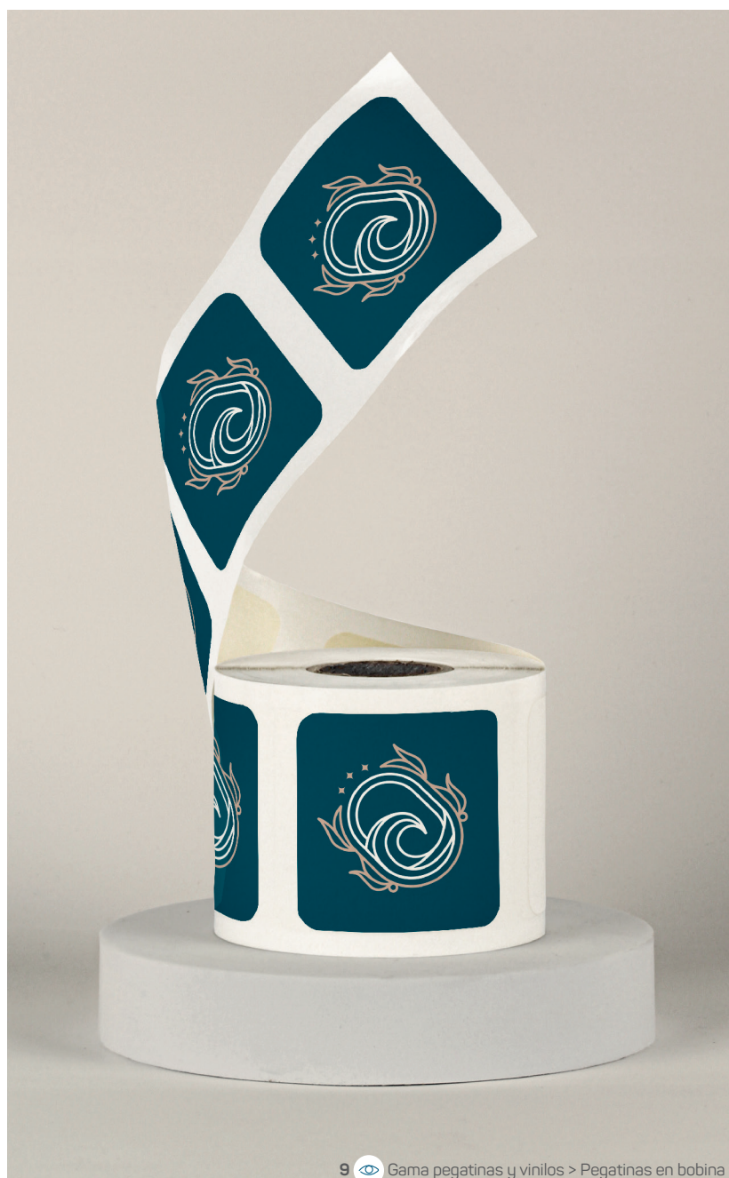
9 Gama pegatinas y vinilos > Pegatinas en bobina